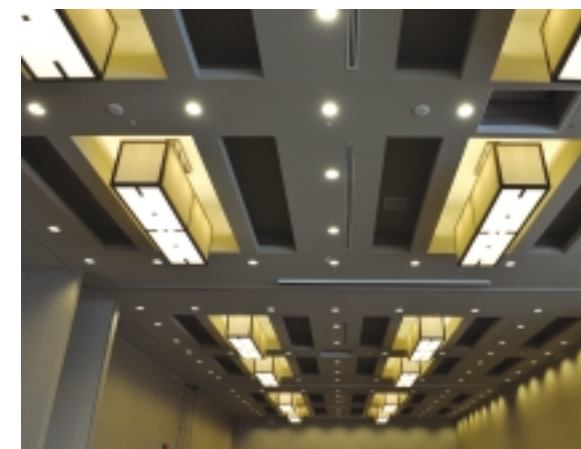
Hôtel Westin : Une des salles de réunion

L’approche est toujours la même - que ce soit pour un grand projet ou une tâche de moindre ampleur. La satisfaction du client est la priorité.