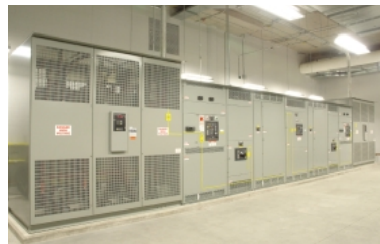
Pavillons Lassonde : Chambre d’équipement électrique avec une sous-station intérieure de haute tension

Nous nous efforçons de faire au mieux, d’une manière plus rentable et plus rapidement que n’importe qui d’autre dans notre industrie.