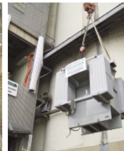
Le Port de Montréal : Installation de transformateurs avec des grues sur une barge

L’installation électrique impliquait un travail dans des secteurs fortement divers, comprenant la nouvelle construction et la rénovation d’espace commercial et industriel.